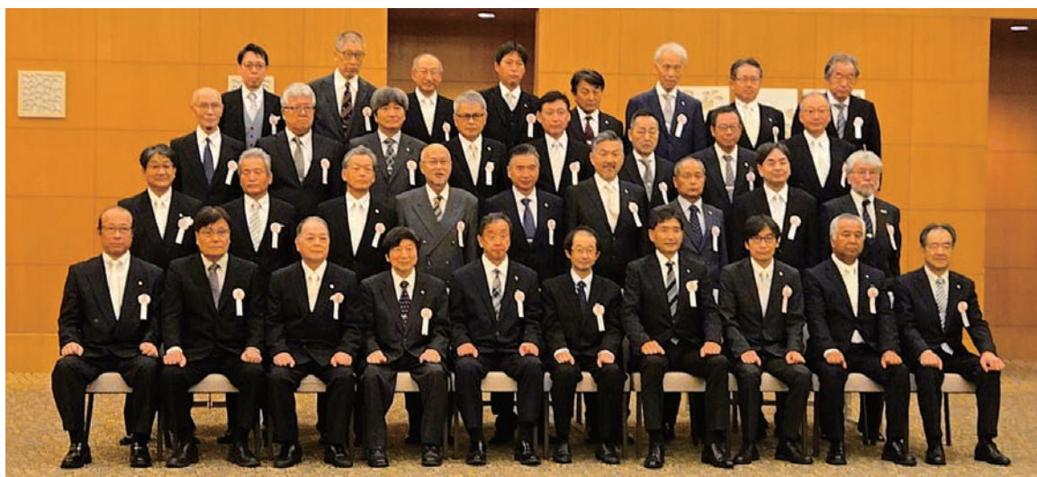
日技会長表彰 記念写真